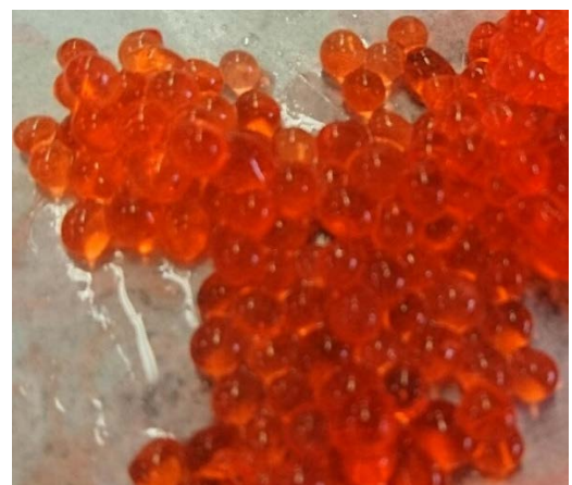
製造した人工イクラ