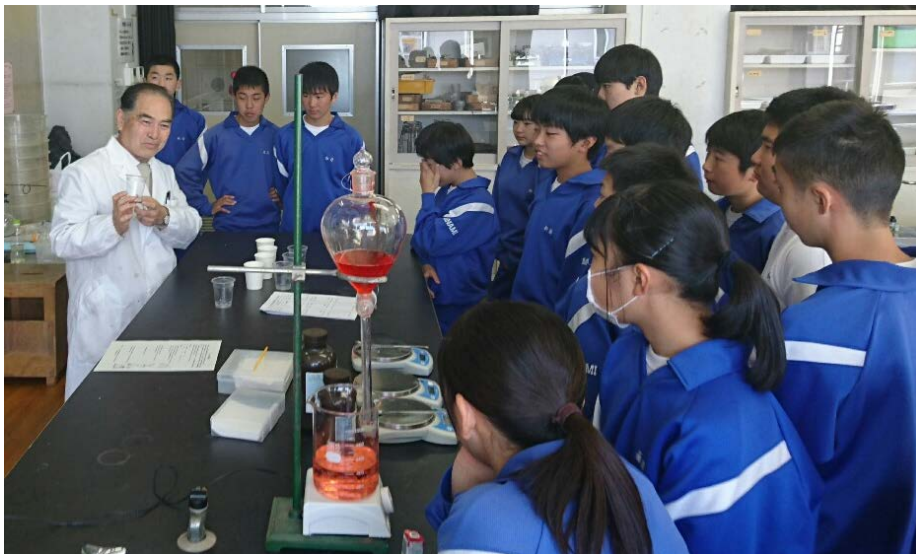
授業の様子「化学マジック」(久喜南中学校)

のべ37名が参加し、化学マジックを見た後、食品化学実験として「人工イクラ作り」を行いました。皆真剣に取り組み、本物のイクラのような製品を製造する技能の習熟が高い参加者もいて、とても盛り上がりました。化学のものづくりに関心を持って頂けました。